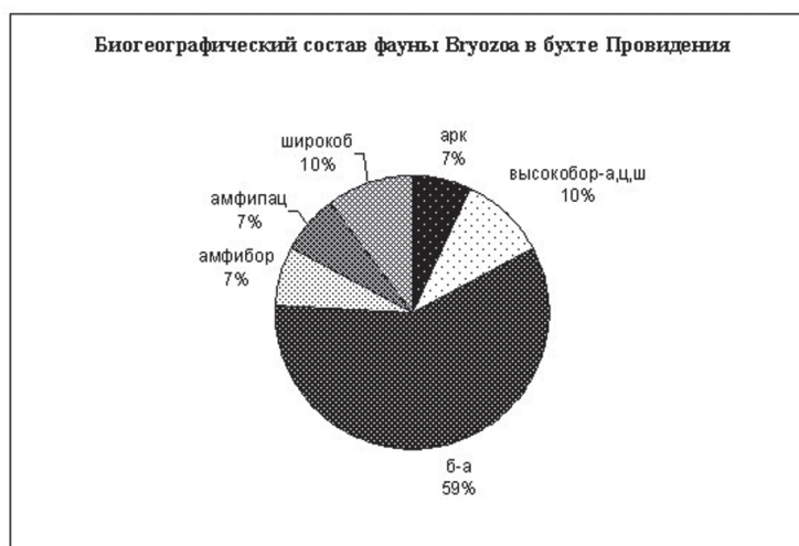
Рис. 2. Биогеографический состав фауны мшанок в бухте Провидения.

В биогеографическом отношении фауна мшанок бухты Провидения имеет холодноводный облик (рис.2)