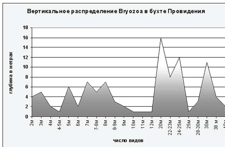
Рис. 3. Распределение мшанок в бухте Провидения в зависимости от глубины.

Наибольшее число видов мшанок в бухте Провидения встречено на глубинах 20–25 м и 30 м (рис.3).