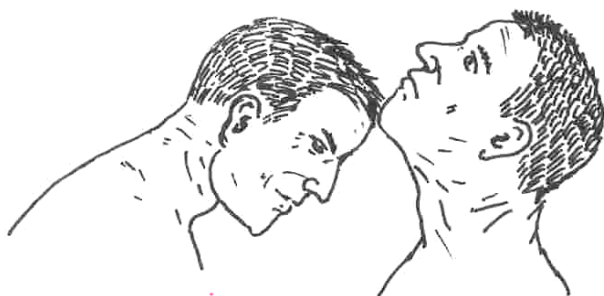
Рис. 1. Удар посадить на калган

Обычно хватало одного или двух точных ударов головой, чтобы сбить противника с ног и лишить его сил к сопротивлению. Старались бить внезапно, подходя вплотную и никак не обозначая своего намерения. Если замысел был ясен, дистанцию сокращали резким прыжком: «...как прыгнешь, как дашь!» — или с разбега таранили противника. В последних двух случаях нападавший старался надернуть противника на себя руками — посадить на голову, на кумпол, на кукан, на калган (рис. 1) 2 , надежно захватив его. Обычно хватали за отвороты одежды, плечи, голову — одной, а чаще обеими руками. Если противник был одного роста или выше нападавшего, то удар обычно наносили под глаз, в губы, под челюсть, под морду, в грудь , опрокидывая его навзничь. Удар могли нанести также в ключицу, в живот, в пузо, под дых, под ложку (в солнечное сплетение), заставляя его упасть согнувшись. В случае если противник был ниже, били в переносицу — смять нос, загнать петушка (носовую перегородку). В коллективных драках толпа на толпу , когда противники дрались вперемешку, в свалку , один из них мог оказаться сзади или сбоку, отсюда информация об ударах в шею или в спину между лопаток с захватом обеих рук сзади, такой удар обездвигивал на некоторое время обе руки противника. Данное техническое разнообразие не было характерным для одного человека, обычно бойцы пользовались одним, максимум двумя такими ударами, удобными им.