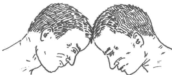
Рис. 2. Игра борьба баранами

Встречались варианты игр, в которых подготовка к удару прослеживалась более явно. Например, при перетягивании опояски одновременно с помощью силы шеи и рук надо было вытянуть своего противника так, чтобы коснуться лбами. Этот вариант явно отражает удар с захватом за отворот или рукава одежды. Были также варианты, когда соперники вытягивали один другого рукой за волосы; переталкивали головой, с легким ударом в лицо проигравшему; перетягивали за голову руками с легким ударом колена в живот проигравшему. В качестве проверки силы удара отмечались игры и забавы с разбиванием кирпичей; ломанием с разбега штакетника, доски или тальника в заборе одного из домов; открыванием дверей или выбиванием их с крючка.