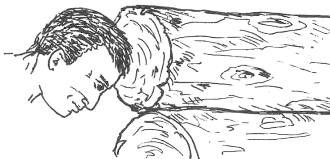
Рис. 4. Удар в торец бревна

Дети и подростки во всем копировали взрослых, только формы их игр были более щадящими и соразмерными возрасту. Они разбивали головой ссохшиеся глыбы земли, шоркали лбом о стенку, приоткрывали ударом или толчком головы двери, вытаскивали из земли забитые деревянные колышки в качестве наказания за проигрыш, тянулись на опоясках и толкались головой. Респонденты, вспоминая детство, рассказывают: «Иногда во время детских игр, оставившись, мы говорили, давай я тебя легонько ударю, а потом ты меня так же! Знали, что когда вырастим, это нам пригодится!» Становясь чуть старше, бравируя перед сверстниками своими способностями, вышибали с разбега дверь в классе — «Главное, шею спрятать глубже в плечи!» . Били головой по подвешенным мешкам или в торец одного из бревен в стене дома (рис. 4), упирались, наносили удары и толчки головой в кожаную подушку (10×10 см), специально прибитую к стене или доске. В последнем варианте, чтобы создать амортизирующий эффект, с обратной стороны доски крепили рессору.