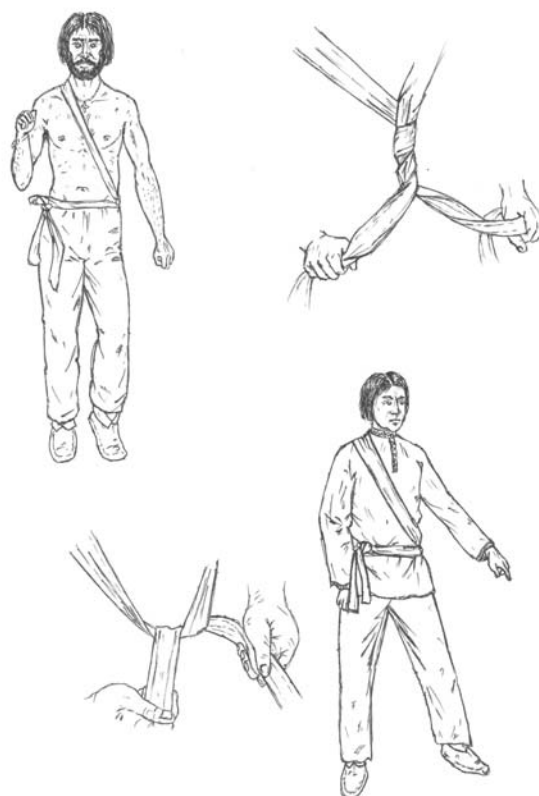
Рис. 1. Способы надевания опояски