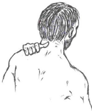
Рис. 5. Захват за шею

10. «Подвал» ( с подвала, подвальца, на голову, через голову, себя ) — броски через грудь, голову в падении.