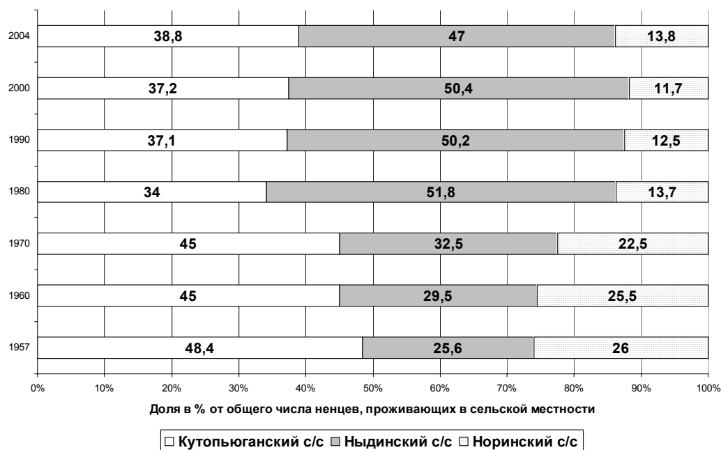
Рис. 2. Распределение ненцев Надымского района по основным территориям проживания, 1957–2004 гг.