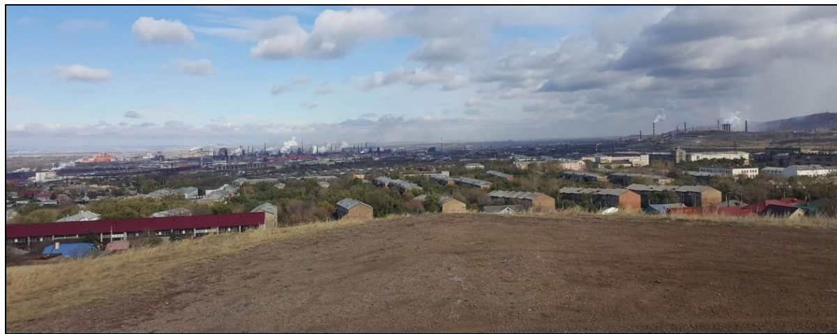
Рис. 1. Индустриальный ландшафт Магнитогорска. Fig. 1. Magnitogorsk's industrial landscape.