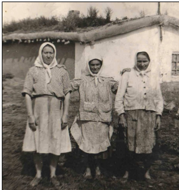
Рис. 2. Жительницы д. Кравцевка (фото из архива Желанновского филиала Музея истории, культуры и быта Одесского муниципального района, 1959 г.).

ней верхней одежды наибольшее распространение имели полушубки или тулупы из овчины. По воспоминаниям местных жителей, в большинстве случаев украинские переселенцы заимствовали прототипы одежды у русского населения Омского Прииртышья. В связи с более суровым климатом в первую очередь заимствованиям подвергались верхняя одежда и обувь. С 1960-х гг. ввиду повышения доступности для сельского населения товаров массового потребления началось вытеснение изготовленной вручную одежды фабричными образцами (рис. 2).