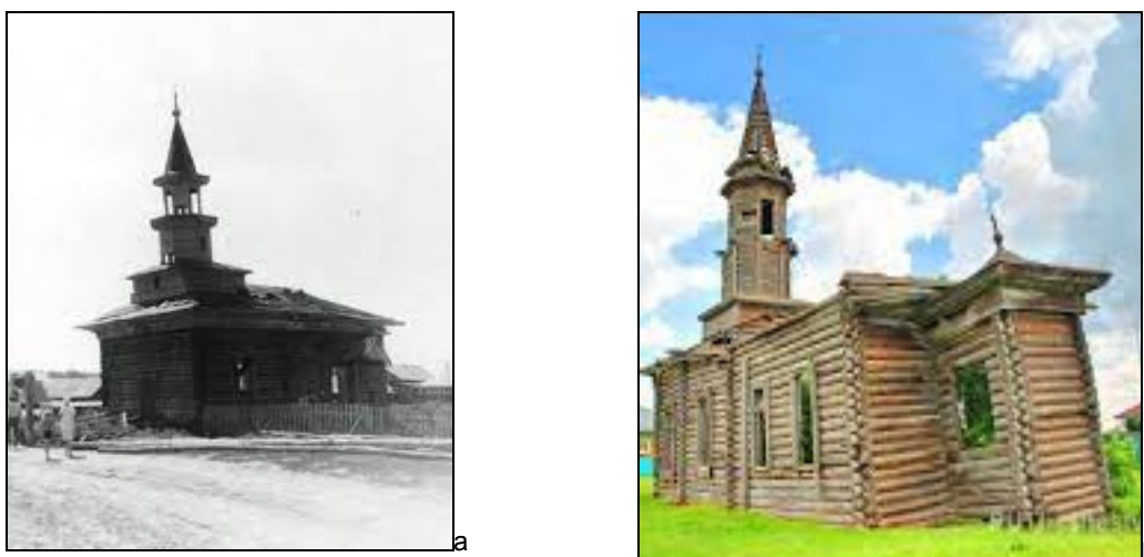
Рис. 3. Деревянные мечети в населенных пунктах Тюменского округа: а — юрты Шайтановские; б — юрты Конченбургские.

По сохранившимся зданиям мечетей, архивным материалам и фотодокументам можно определить основной вид деревянных мечетей, возводившихся в Тобольской губернии. Мечеть представляла собой прямоугольное одноэтажное здание с двускатной крышей. Со стороны входа — крыльцо-сени, далее — молельный зал с 2–5 окнами и примыкавший к нему михраб. Минарет располагался на крыше, ближе к северной части, как правило над входом (рис. 3а, б). Такой вид мечетей был распространен не только в Сибири, но и в Европейской России.