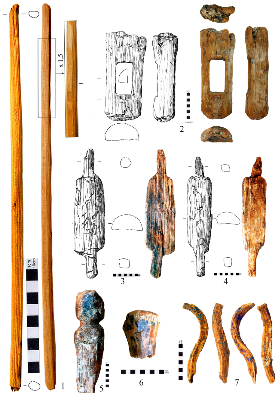
Рис. 6. Деревянные изделия и предметы с поселения Каменный Амбар:

1 — хорошо обструганная палочка, возможно, древо стрелы (колодец 2/4); 2 — изделия из полубревна с прямоугольными отверстиями (колодец 2/9); 3, 4 — изделия из полубревен с «ручками» («скалки») (колодец 3/1); 5 — изделие непонятного назначения; 6 — «навершие» или пробка бурдюка (колодец 5/9); 7 — изделие с дуговидной формой (колодец 2/9);