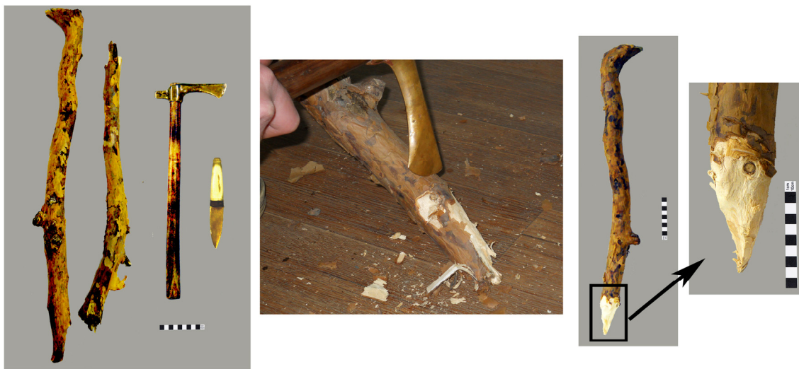
Рис. 5. Экспериментальное изготовление кола (И. Молчанов). Fig. 5. Experimental fabrication of the wooden stake (I. Molchanov).

диаметром около 5 см, вбитых по периметру шахты и оплетенных между собой ветками диаметром от 1,5 до 3 см. При диаметре колодца в 60 см диаметр конструкции в нижней части составил 57–60 см.