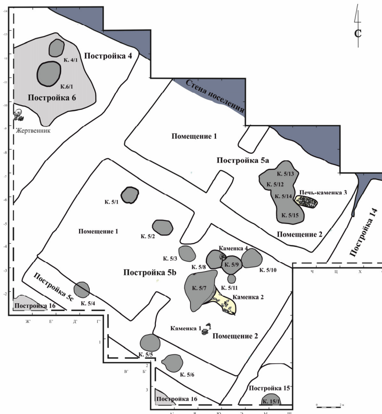
Fig. 2. Колодцы в северной части поселения Каменный Амбар (раскоп 6). Fig. 2. The wells in the North of the Kamenny Ambar settlement (trench 6).