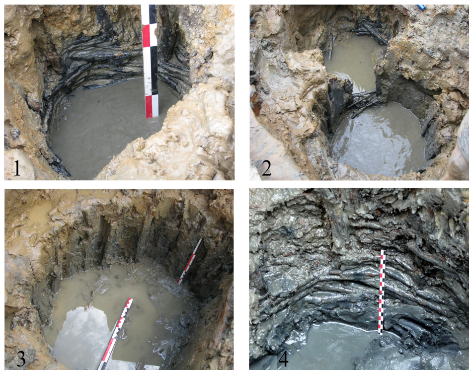
Рис. 4. Колодцы с остатками опалубок: 1 — колодец 2/1; 2 — колодцы 2/1 и 2/1а; 3 — колодец 2/1а; 4 — колодец 2/9. Fig. 4. Wells with remains of the timbering: 1 — well 2/1; 2 — wells 2/1 and 2/1а; 3 — well 2/1а; 4 — well 2/9.

дания им остроты использовались топор или/и тесло, ширина лезвия которого не превышала 3 см. Следы затесов располагаются в направлении от «центра к окончанию».