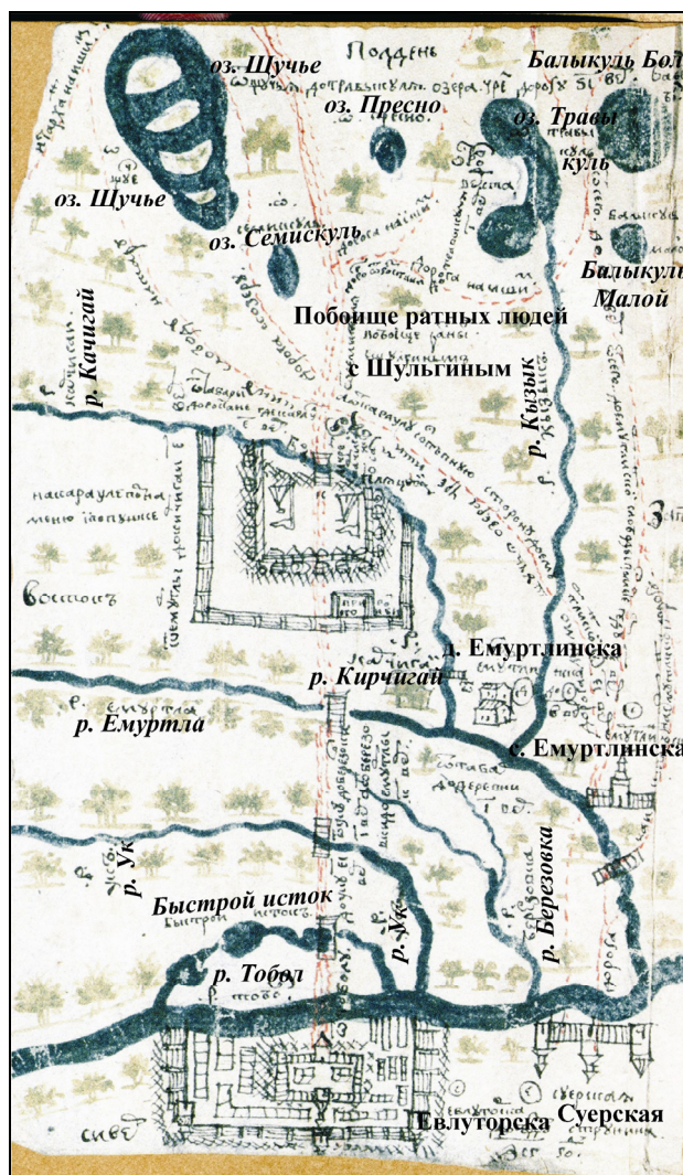
Рис. 4. Карта Струнина 1695 (Доезд 7203).

шой отряд (600 чел.) Федора Туталмина в степи нападавших не нашел [Записки, к сибирской истории, 1788, с. 278; Маслюженко и др., 2015, с. 99]. Улучшение обороны русских было в том, что нападение отбили, и сразу было организовано преследование. К сожалению, справиться со степняками русские не смогли, а подкрепление следов нападавших не нашло.