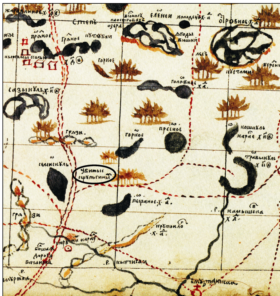
Рис. 2. Фрагмент листа 106 «Хорографической книги» с указанием места битвы Шульгина.

анный населенный пункт. В 5 верстах выше от Табар находился караул «со знаменем и пушкой». Вероятно, этот самый караул показан на листах ремезовских карт, упомянутых выше.