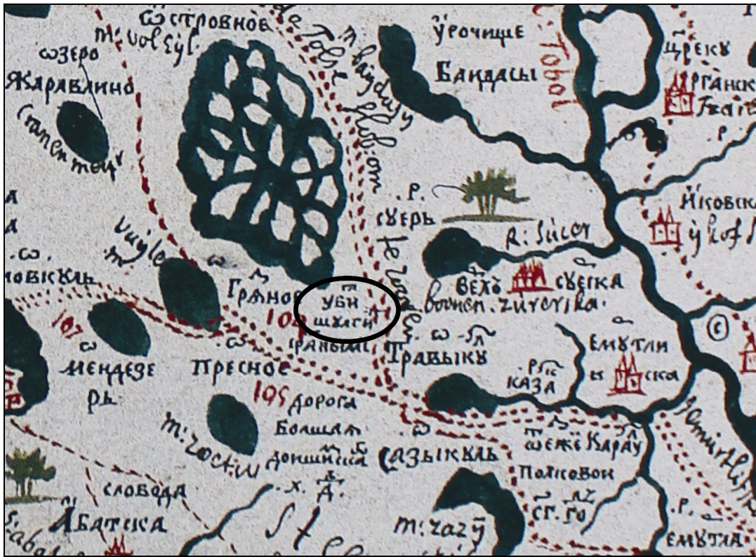
Рис. 3. Лист К «Чертежной книги и место боя Шульгина