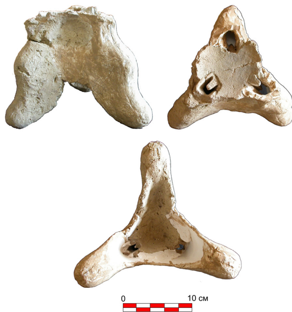
Рис. 3. Трипод из помещения 11.

По этой причине некоторые исследователи появление алтарей и других культовых изделий, применявшихся в ритуалах храмов Средней Азии, связывают с распространением зороастризма на обширных территориях региона, так же как использование в культовой практике хорезмийцев, согдийцев и тохаристанцев алтарей определенного типа, аналогичных «аташданам» Парса и ранних Сасанидов. Но надо отметить, что еще в V в. до н.э. Геродот писал о персах, что они не возводят ни статуй, ни храмов, ни алтарей. А в Средней Азии имеются данные об использовании в храме Джаркутан инвентаря для проведения ритуалов (переносные алтари) в эпоху бронзы [Ширинов, 1993]. Все это позволяет отметить, что переносные алтари в культовых ритуалах Согда имеют ранние корни в автохтонных культурах. Но, как видим, хантепинская находка по своим формам заметно отличается от согдийских переносных алтарей и курильниц. Можно сказать, что она имеет своеобразные черты, которые не наблюдаются в курильницах и алтарях Ирана.