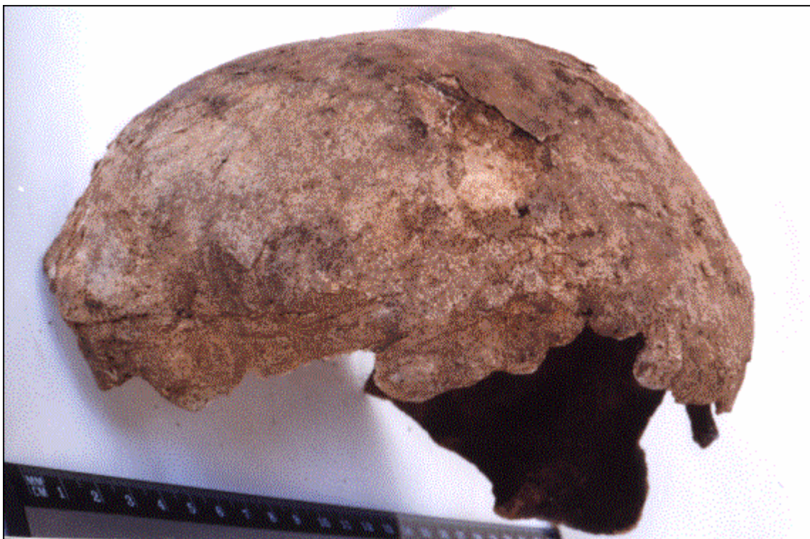
Рис. 2. Череп со следами скальпирования из "погребения 78" Сайгатинского VI могильника

кости, на левой теменной кости, на чешуе затылочной кости. На лобной кости порезы выражены наиболее четко. На задней части теменной и на затылочной костях они видны хуже, поверхностная пластинка в этих местах существенно разрушена. Длина порезов 20–26 мм, глубина до 1 мм, края ровные, параллельные друг другу. Плоскости порезов образуют с поверхностью черепа острые (открытые вниз) или близкие к прямым углы. Оси порезов составляют с вертикальной осью черепа углы 70–80°, открытые вверх. Следов заживления нет. Патологических изменений поверхности костей свода черепа не обнаружено. Выявленные повреждения свидетельствуют о проведении циркулярного разреза кожи головы. Разрез был сделан незадолго до смерти человека или вскоре после нее.