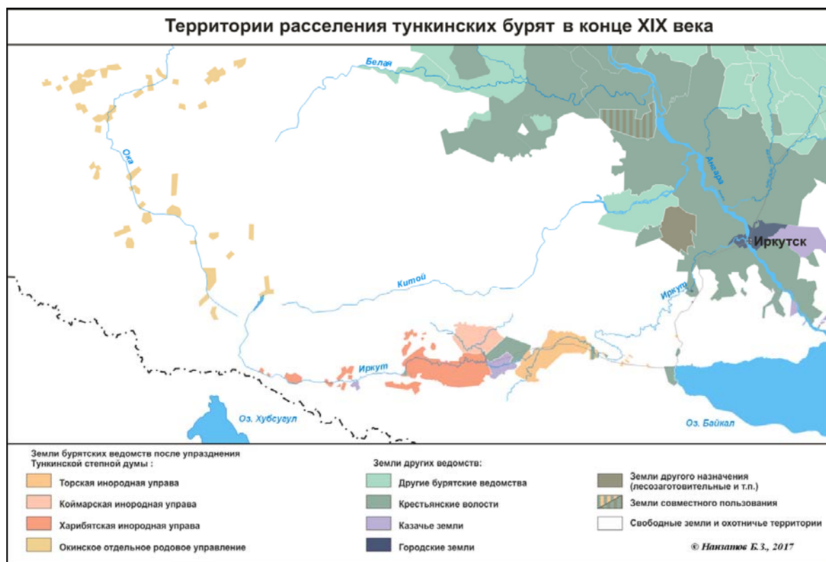
Рис. 1. Территория расселения тункинских бурят в конце XIX в.

Авторы статьи ставят своей целью исследование этнического состава тункинских бурят и особенностей их расселения на территории Тункинской степной думы в XIX в., необходимое для дальнейшего изучения этногенеза и этнической истории бурят и тюркских народов Южной Сибири. В работе представлен наиболее полный перечень макро- и микроэтнонимов общностей, вошедших в состав этнотерриториальной группы тункинских бурят, а также в состав современных сойотов. На основе историко-лингвистического анализа макроэтнонимов предложена авторская версия происхождения этнических групп. Другой важной задачей настоящего исследования стала реконструкция сети расселения этнических групп бурят на территории Торской, Коймарской и Харибятской инородных управ и Окинское отдельного родового управления в конце XIX в. Данная работа базируется на материалах переписи 1897 г., обработанных С.К. Паткановым, данных архивных материалов, полевых исследований авторов, позволивших восстановить наиболее полную картину расселения бурят с указанием всех населенных пунктов, существовавших в конце XIX в., статус территорий (бурятские земли, казачьи земли), численное соотношение административных родов.