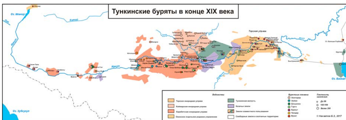
Рис. 2. Тункинские буряты в конце XIX в.

Торская инородная управа (рис. 2, табл. 1) была расположена в восточной части долины Иркутка и его притока Зун-Мурино, вплоть до юго-западной оконечности Байкала, где находились летники бурят. Охотничьи угодья торских бурят граничили с угодьями закаменских и китойских бурят. На территории ведомства находилось общебурятское (изначально общебулагатское) культовое место — гора Буха-нойон, место почитания мифического предка бурят (булагатов) [Шагланова, 2007, с. 19–24]. В районе Култука находилась гора Шаманка на одноименном мысу, место поклонения хозяину Байкала — Далай-Лусун-хана [Там же, с. 30–31].