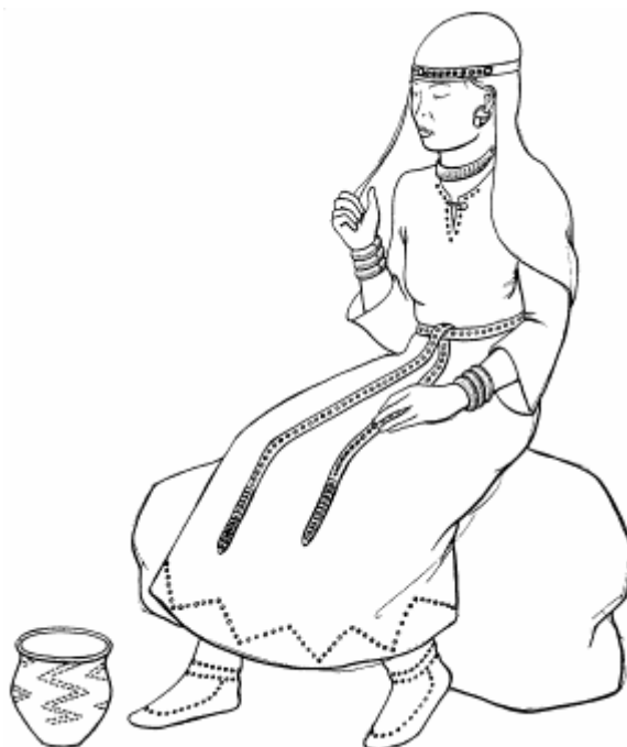
Рис. 2. Могильник Дашти-Козы, погр. 15. Реконструкция костюма.

При этом если само платье и головной убор мы рассматриваем в диахроническом аспекте, акцентируя внимание на его среднеазиатском происхождении, то ювелирный декор интерпретируется в синхронии. Он сочетает в себе «импортные» и «местные» украшения. Серьги с раструбом по праву считаются «визитной карточкой» степных племен федоровской культуры андроновской общности. По мнению Н. А. Аванесовой, этот тип серег является наиболее ярким этнокультурным признаком (после керамики), по которому опознается федоровская культура [1991, с. 53]. А вот гривна и браслеты такого вида не имеют аналогов в ювелирных женских наборах из памятников эпохи бронзы степной зоны [Там же, с. 67–70, рис. 51–54].