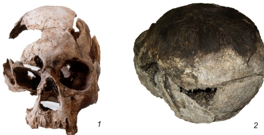
Рис. 4. Проникающие ранения без следов заживления: 1 — Сайгатинский 6, № 9, вид спереди; 2 — Сайгатинский 6, № 10, вид сзади слева

4-й тип травматических повреждений: проникающие ранения без следов заживления (рис. 4). Этот, последний тип повреждений, выделенный среди травм средневековой таежной выборки, может иметь большое разнообразие морфологических проявлений. Объединяющей чертой для этого типа является дефект, проникающий в мозговую полость, и отсутствие следов репарации. В эту категорию попадают повреждения на черепках № 9, 10, 15.