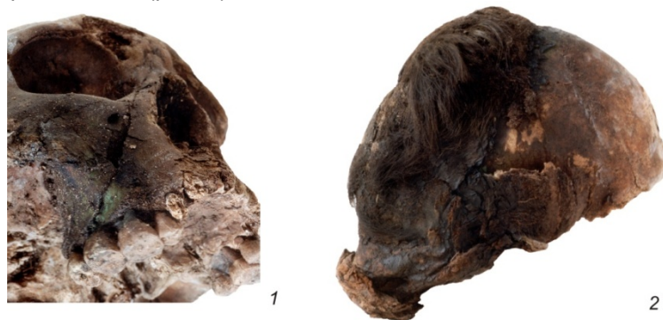
Рис. 5. Особые случаи проникающих ранений без следов заживления: 1 — Сайгатинский 6, № 16; 2 — Сайгатинский 6, № 17

В исследуемой выборке данный тип повреждений представлен щелевидными и дырчатым переломами. Щелевидные переломы располагаются в левой части чешуи лобной кости черепа № 9 и на левой теменной кости черепа № 10. Морфология повреждений позволяет однозначно реконструировать механизм их образования как разруб остролезвийным предметом, например саблей. Очевидно, к этой же категории относятся и рубленое ранение лица на черепе № 16, и отсечение головы, установленное по комплексу костных элементов в окружении мумифицированных тканей «черепа» № 17 (рис. 5).