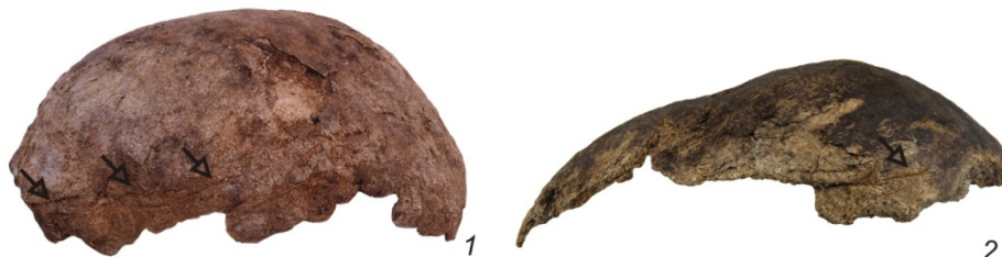
Рис. 3. Полоса надрезов на черепках: 1 — Сайгатинский 6, № 8; 2 — Зеленый Яр, № 14. Повреждения показаны стрелками

3-й тип повреждений: полоса надрезов вокруг мозговой коробки. Данный тип, как и предыдущий, является комплексным, представляя собой последовательность неглубоких вдавленных переломов длиной 2–3 см, глубиной около 1 мм, опоясывающих мозговую коробку. В исследуемой выборке все повреждения такого типа оказались без следов заживления. К этой категории относятся повреждения на черепках № 8 и 14 (рис. 3).