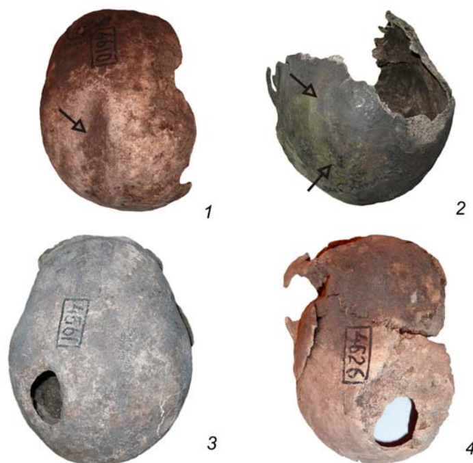
Рис. 1. Единичные овальные повреждения:

1 — могильник Барсовский 1, № 1 по табл. 1; 2 — Сайгатинский 3, № 11; 3 — Сайгатинский 3, № 13; 4 — Барсовский 1, № 6. На 1 и 2 повреждения показаны стрелками