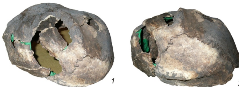
Рис. 6. Особое повреждение на черепе № 12 из могильника Сайгатинский 3. Вид слева сзади и сзади

число поражений составляет 7 %, на следующем этапе стремительно уменьшается до 1 %. Значительная разница наблюдается для локальных выборок. Так, в барсовской группе показатель конфликтного травматизма максимальный в данном исследовании и составляет около 8 %, почти одинаково затрагивая и мужчин и женщин. В сайгатинской же совокупности он в 2 раза ниже и касается только мужчин.