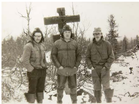
Рис. 2. Кресты. 1980-е гг.

краской, к 70-м годам краска почти вся облупилась, ее следы остались только в пазах, где перекладины соединялись с основанием. К 1992 г. крест у основания перегнил и упал, затем его прислонили к соседнему дереву.