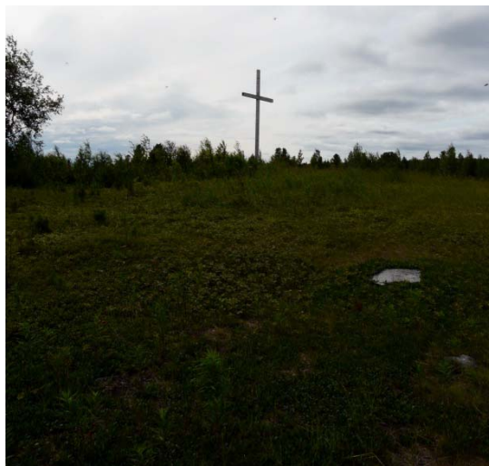
Рис. 4. Урочище «Кресты», 2009 г.

лизовать его, не нашло понимания среди жителей Мужей 3 . В подтверждение этого следует отметить, что, несмотря на несоответствие действительности, последний из установленных крестов в селе и по сей день продолжают называть «черкашинским».