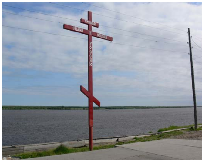
Рис. 6. Современный крест на берегу Оби в с. Мужы, 2009 г.

В середине 2000-х гг. в центре Мужей на берегу Оби по инициативе церкви и поддержке местных предпринимателей был поставлен придорожный восьмиконечный металлический крест с надписью «Господи спаси и сохрани Россию», охраняющий путников и проходящие суда (рис. 6). Место установки креста было выбрано не случайно. Во-первых, роль большой дороги в северном поселке традиционно играет река — летом ходит водный транспорт, зимой по реке проходит зимник. Раньше место, где установлен крест, называлось «Почтовская гора», так как мимо проходил тракт, было построено здание почты. На Почтовской горе традиционно устраивались праздничные гуляния, катались на лыжах, санках; сотрудники современного музея «Коми изба» организуют здесь празднества на Троицу [Ануфриева Т.В.].