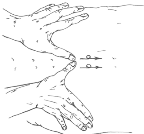
Рис. 3. Массаж спины с помощью приема растирания

Массажистка окунала руки в теплую воду, мылила хозяйственным мылом и начинала массаж с пальцев руки и предплечья, растирая их большими пальцами. Затем массировали вторую руку. Выше к плечевому суставу массировали уже с помощью всех пальцев. Затем массирова-