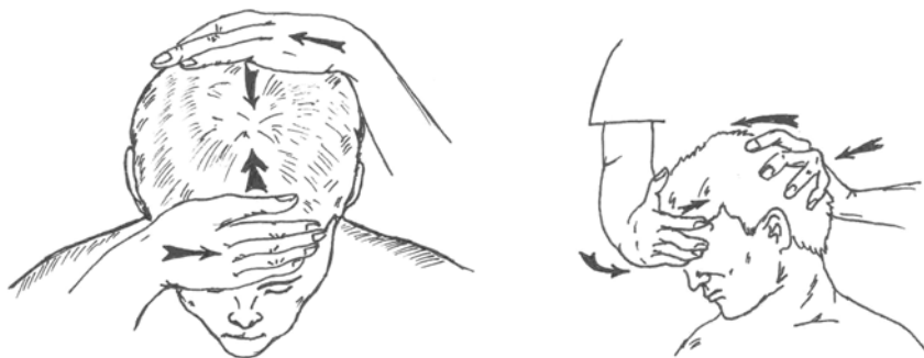
Рис. 8. Массаж головы