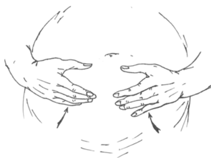
Рис. 6. Массаж беременной (прием «приподнимание»)

«Надавливание» и «приподнимание». Эти движения использовали при массаже головы. Если болит голова или был ушиб, делают замер черепа рогожей. Голову обматывают веревкой, углем ставят метки: посередине лба и на затылке, у основания ушей (некоторые — на висках). Затем эти метки соединяют (лоб и затылок; уши). Как прокомментировал И.В. Артеев, «если какая-то сторона провисает, метки не сходятся — смещение черепа». В этом случае правят голову — сжимают черепную коробку надавливающими движениями, с разных сторон, при этом как бы приподнимая к центру. После этого делают новый замер, и если метки сошлись, то рогожу сжигают в печи или выбрасывают. Если метки не сошлись — правят еще раз. И так до тех пор, пока метки не сойдутся (обычно два-три дня, по одному разу, в течение двадцати-тридцати минут; возможны иные комбинации, например в день несколько раз; надавливающие движения делать «раза три»). Сила движений зависела от пациента — ребенок это или взрослый, взрослым сдавливали сильнее (рис. 7).