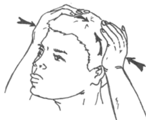
Рис. 7. Массаж с помощью приемов «надавливание» и «приподнимание»

«Надавливание» и «приподнимание». Эти движения использовали при массаже головы. Если болит голова или был ушиб, делают замер черепа рогожей. Голову обматывают веревкой, углем ставят метки: посередине лба и на затылке, у основания ушей (некоторые — на висках). Затем эти метки соединяют (лоб и затылок; уши). Как прокомментировал И.В. Артеев, «если какая-то сторона провисает, метки не сходятся — смещение черепа». В этом случае правят голову — сжимают черепную коробку надавливающими движениями, с разных сторон, при этом как бы приподнимая к центру. После этого делают новый замер, и если метки сошлись, то рогожу сжигают в печи или выбрасывают. Если метки не сошлись — правят еще раз. И так до тех пор, пока метки не сойдутся (обычно два-три дня, по одному разу, в течение двадцати-тридцати минут; возможны иные комбинации, например в день несколько раз; надавливающие движения делать «раза три»). Сила движений зависела от пациента — ребенок это или взрослый, взрослым сдавливали сильнее (рис. 7).