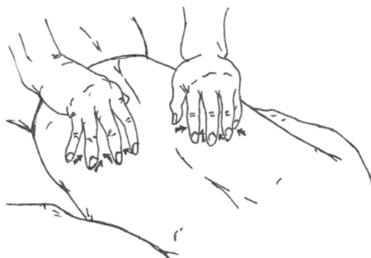
Рис. 9. Массаж спины