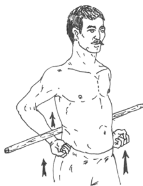
Рис. 5. Самомассаж палкой (прием «приподнимание»)

Самомассаж приподниманием практиковался при помощи палки, «просовывали ее между руками» и «сами себя приподымали», по сути делая то же движение, что описано выше (Е.А. Вокуев) (рис. 5).