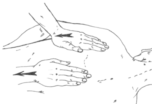
Рис. 1. Массаж с помощью приема поглаживания

Растирание. «Как массаж, и руки потрет, и грудь. Живот сильно не терла» (Т.П. Чупрова).